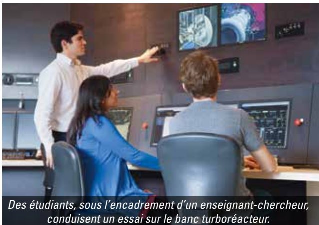
Des étudiants, sous l'encadrement d'un enseignant-chercheur, conduisent un essai sur le banc turboréacteur.

▀ MASTERS EN PARTENARIAT : ces diplômes, conçus avec des universités et des grandes écoles,