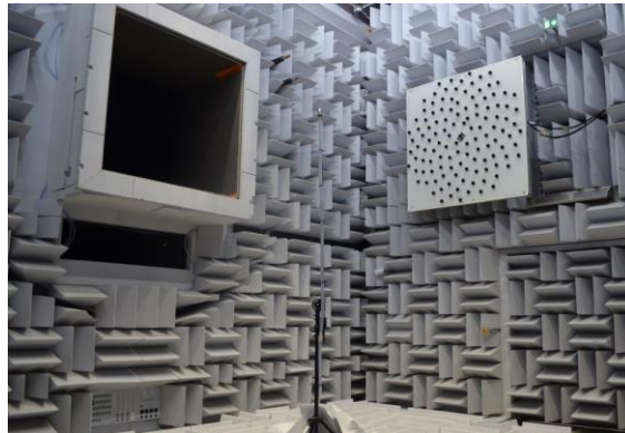
Figure 2: Antenne de localisation de 120 microphones dans la Soufflerie AéroAcoustique de l'ISAE-SUPAERO.

L'objectif de ce stage est développer un algorithme de localisation de sources aéroacoustiques inspiré de la statistique bayésienne. Dans un premier temps l'étudiant mènera une étude bibliographique sur le sujet et prendra en main les techniques de localisation de sources en implémentant un algorithme d'antennerie qui reste la technique de référence dans ce domaine. Ensuite il implémentera un algorithme de localisation de sources basé sur les approches bayésiennes sélectionné suite à l'étude bibliographique. Ces algorithmes seront alors validés sur des champs synthétiques de référence (monopoles, dipôles...) et leurs performances respectives seront évaluées. Enfin l'application de ces outils à la localisation de sources aéroacoustiques en soufflerie sera abordée en cherchant notamment à tirer parti des spécificités de l'approche bayésienne pour optimiser la répartition des microphones de l'antenne pour une configuration d'essai donnée. Un exemple d'antenne de localisation de sources utilisée dans la Soufflerie AéroAcoustique de l'ISAE-SUPAERO est présenté Figure 2.