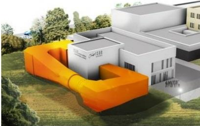
Figure 2: Soufflerie AéroAcoustique de l'ISAE-SUPAERO.

L'objectif de ce stage est d'étudier le potentiel des méthodes SPOD pour l'analyse de données aéroacoustiques. Dans un premier temps, l'étudiant mènera une étude bibliographique sur le sujet et prendra en main les techniques SPOD [3]. Le potentiel de ces techniques pour l'aéroacoustique sera ensuite évalué sur données issues de simulations haute-fidélité obtenues pour les jets supersoniques impactant une paroi avec différents angles [4]. Une visualisation de ces simulations est présentée sur la Figure 1. Grâce à cette technique, pour ce type d'écoulement, les différentes sources acoustiques situées au niveau des couches limites et de la zone d'impact dont le contenu fréquentiel est similaire devraient pouvoir être étudiées de manière indépendante les unes des autres [1]. Suivant l'avancement du stage et des campagnes expérimentales menées au laboratoire, l'application de cette technique à des mesures optiques par PIV réalisées dans la Soufflerie AéroAcoustique de l'ISAE-SUPAERO sera également abordée.